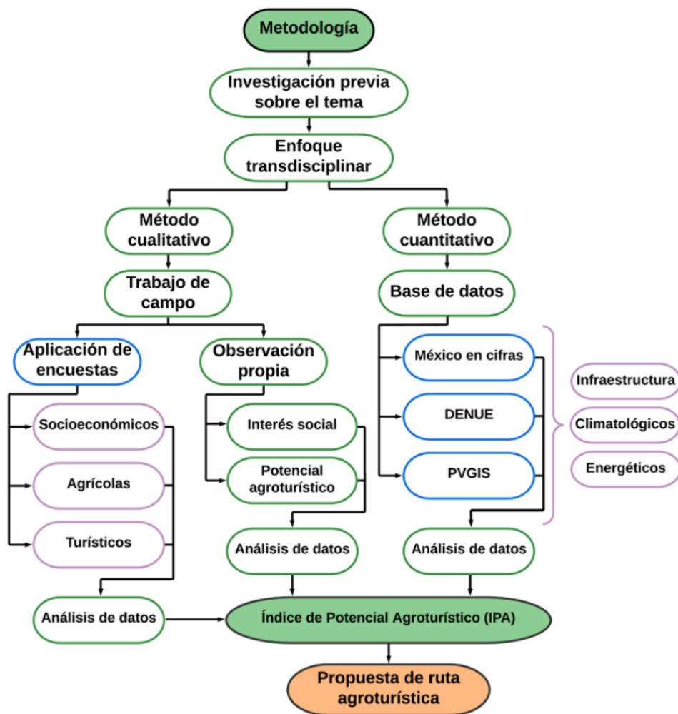
Figura 3. Metodología Transdisciplinar para identificar sitios con potencial agroturístico. Elaboración propia.