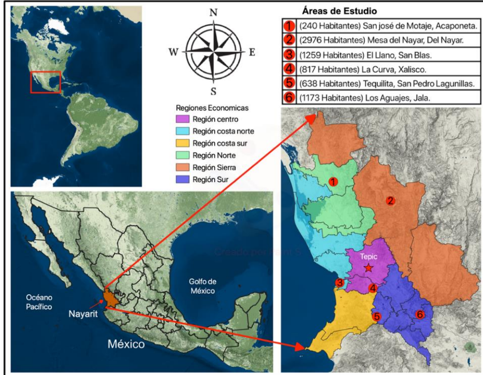
Figura 2. Áreas de estudio. Elaboración propia mediante QGIS, con información contenida de (INEGI, 2021).

5 de las 6 regiones económicas del estado de Nayarit (figura 2).