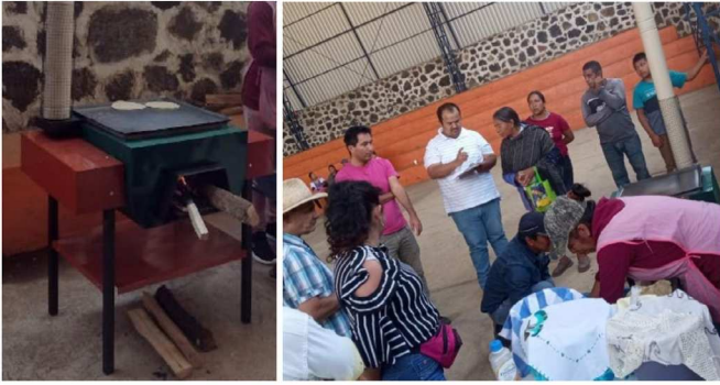
Figura 3. Demostración comunitaria de estufas

lando nuevos dispositivos es fundamental por varias razones. En primer lugar, las necesidades y condiciones varían significativamente en diferentes partes del mundo. Por lo tanto, es necesario adaptar la tecnología a estas variaciones locales para garantizar su eficacia, relevancia y aceptabilidad. Desarrollar dispositivos que sean adaptables a diferentes tipos de biomasa disponibles localmente, así como a distintos climas y entornos, es esencial para su aplicación práctica y sostenible.